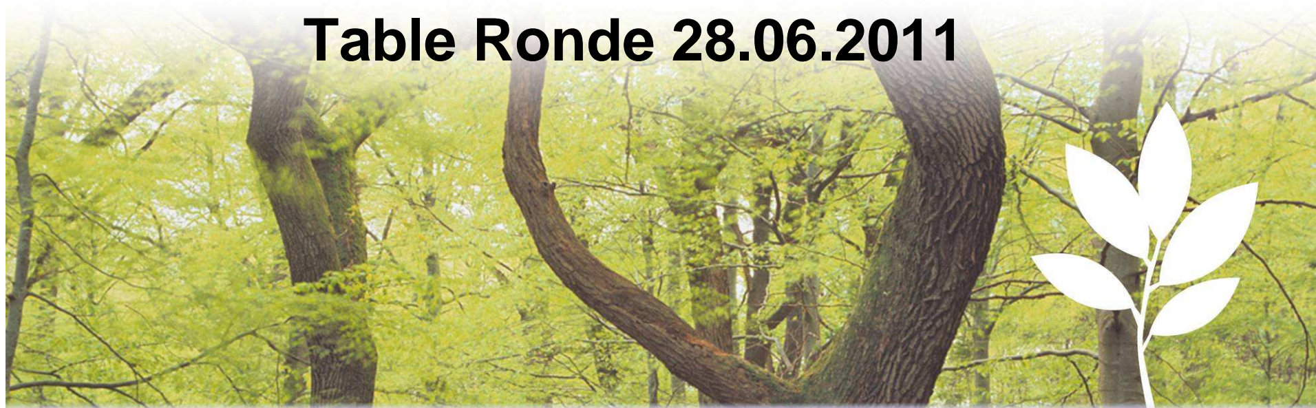
Table Ronde 28.06.2011